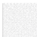
cm 60 x 60 24" x 24"