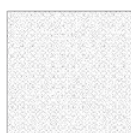
cm 60 x 60 24" x 24"