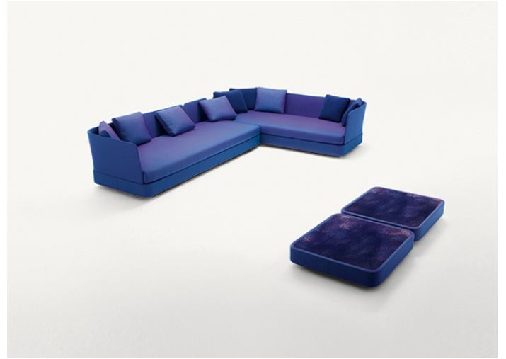
B25D + B25N + n° 2 B25SCS + n° 4 B25SCA + B25SCD + n° 2 B25H