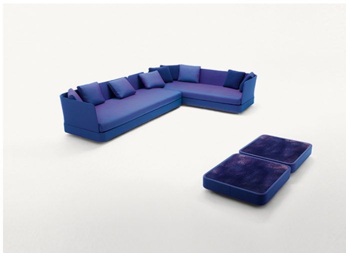
B25D + B25N + n° 2 B25SCS + n° 4 B25SCA + B25SCD + n° 2 B25H