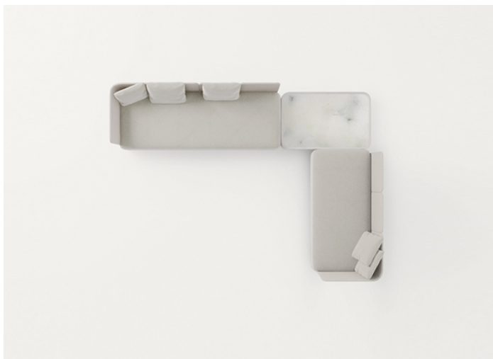
B25D + B25SCS + n° 3 B25SCA + B25L + B25N + n° 2 B25SCA + B25SCD